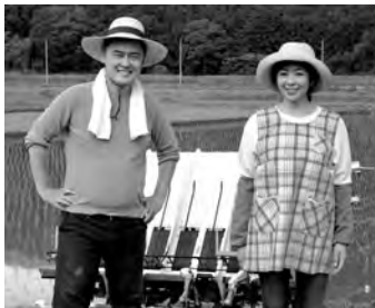
農業者年金に加入すれば～農業者年金の支給額の試算～（金額：万円未満四捨五入）