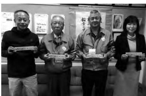
令和2年3月 稲葉小学校にて