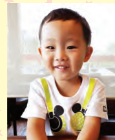
やなしまりょうた 梁島涼太くん (H28.11.22生)