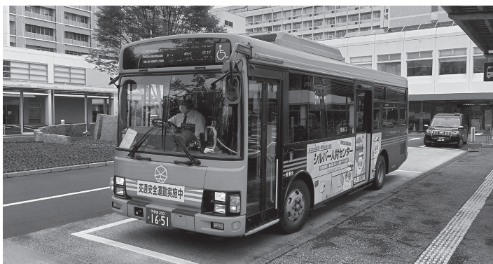
壬生町・下野市・上三川町をつなぐ「ゆうがおバス」