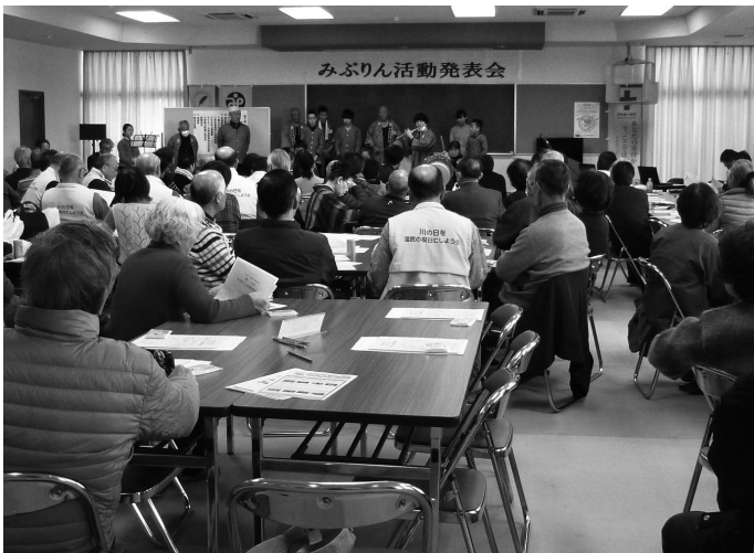
昨年のみぶりん活動発表会の様子