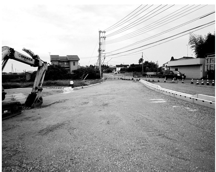
町道53号線の整備状況

課題を解決する方法として、情報通信技術に係る環境整備で業務の見直し・細分化をおこない、在宅で可能な業務の幅を広げること、電話・メール、庁舎内の業務システム等の活用でコミュニケーションの手段を増やすこと、事務マニユアルの整備等で生産性の向上・効率化を図ること等の対策があります。