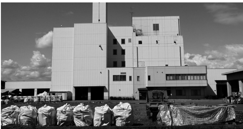
基幹的設備改良工事による延命化が期待される壬生町清掃センター

開始後は予定した人数を超えてしまい抽選となったことから、令和元年度は補助金を増やした結果、希望者全員に助成することができました。