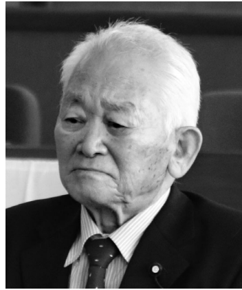
江田 敬吉 議員

問 全国的に地方議会の意識調査結果が報告され、どの報告書も共通した意見は、議会も議員も何をやっていいのかわからない。極端な意見は、議会不要論の意見までありました。この意識調査結果をどのように見ておられるか考えを聞きたい。