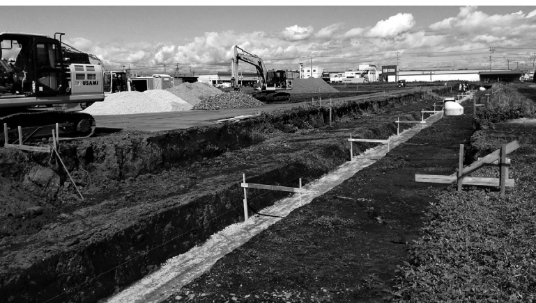
六美町北部土地区画整理事業

令和元年度は仮換地の設計をされました。現在は、既に仮換地案ができており、一人ひとりの方にご理解いただくための説明をしている段階です。