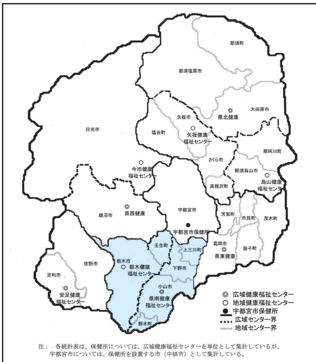
栃木県南保健所の管轄区域 (HP「保健所管轄区域案内 栃木県」より作成)

の最大需要数に関しても、検討しており、8月12日より機動調査チームを組んで体制を整えています。町では、県の動向を見ながら、できる範囲のことで協力させていただければと考えています。