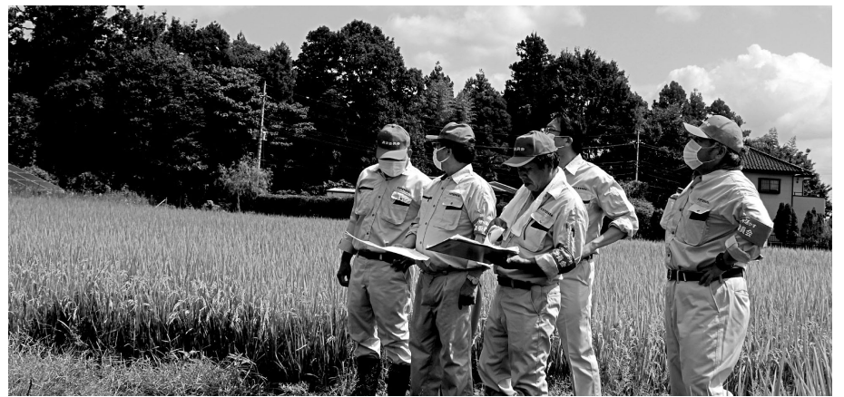
農業委員会による農地パトロールの様子

122件の陳情を受けています。内容は拡幅の要望が半分、次いで雨水処理、舗装修繕となります。