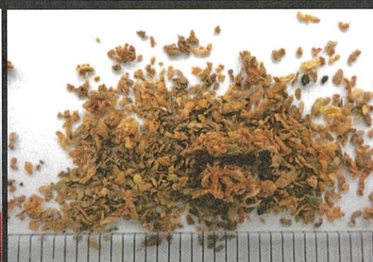
フラスの内容物にはノミで削ったような 薄い木くず片が含まれている