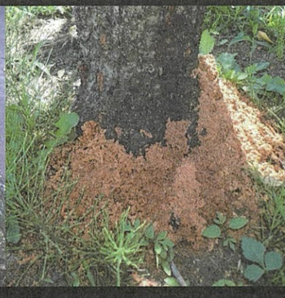
赤茶色のフラスが株元に積もったサクラ(左)とモモ(右)