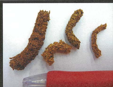
木くずと幼虫の糞が固まっ かりんとう状となる