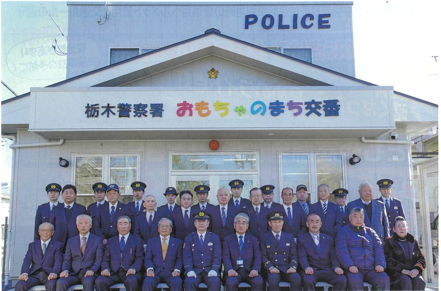
令和6年1月30日、改築したおもちゃのまち交番の開所式を開催しました。

発行・栃木警察署 ☎0282-25-0110(代)・栃木地区交通安全協会・栃木地区防犯協会