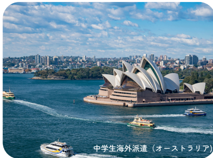
中学生海外派遣（オーストラリア）

切れ目のない子育て支援、こどもの居場所づくり等を通じ、未来を担う子どもたちを支えます。