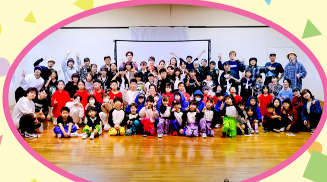
Dance studio LOOP