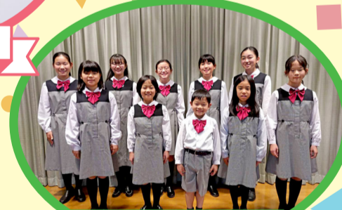
壬生少年少女合唱団