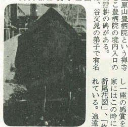
豊酒院にある雪耕の碑