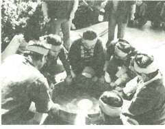
ハンギリに御飯を入れ、御神酒をかけながら練り山型をつくる

上田地区宿坪では、十一月二十三日村鎮守、磐裂神社に五穀豊穣を感謝して「ハンギリ」と呼ばれるクワイに似た大型の桶に、新米の御飯をおりつけ奉納する。珍しい祭りが行われています。この祭りは、ハンギリを使う「ハンギリ祭り」とか、「ヤンセヤンセ」とかけ声をかけながらむとむとにより、「ヤンセミ」とも呼ばれています。かつては男だけの祭りだったそうです。