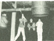
大層口には一般解放される。

大晩日の夜、ゴーン、ゴ ーンという鐘の音が町中に響き わたるとともに、年が ажける 常楽寺（仲通り）の除夜の鐘 この鐘は、昭和十七年に戦