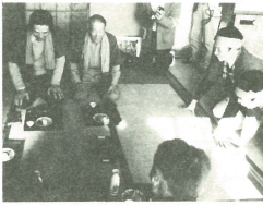
ハンギリが重くて持ち上げられないので、元老に助けを頼む