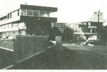
間もなく完成する南犬飼中校舎

昭和二十五年三月十二日、新 校舎への移転の日。四七〇名の 当時の生徒たちは、憧れと期待 をもって机や椅子をかつき、借 り校舎に別れを告げました。長 蛇の列は、田圃を横切り、河岸 段丘を越えて現在地へ、まさに 舎の屋根瓦のせせ業。校庭の抜 根作業、土砂運搬、地ならし作 業に黙々と従事する少年少女の