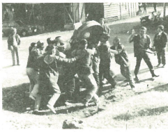
やとハンギリが上がる若衆たちは一心不乱にハンギリをもみます