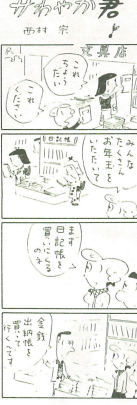
修理を依頼するとき

修理を依頼するとき 電気製品は、製造が打ち切ら れた後も、補修用品は一定期 間保存されています。修理を依