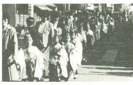
華やかな稚児行列

雄琴神社の神幸祭稚児行列 この祭りは、毎年十一月二十九日、雄琴神社の新嘗祭（秋まつり）の日に行われている「新嘗の義で、「新」は新穀、「嘗」は「馳走の意味です。春の初めの祈年祭に五穀豊穣を祈り、神の恵みにより、今の収穫を見ることのできたので、その新穀をお供えて神恩を謝するものがこの